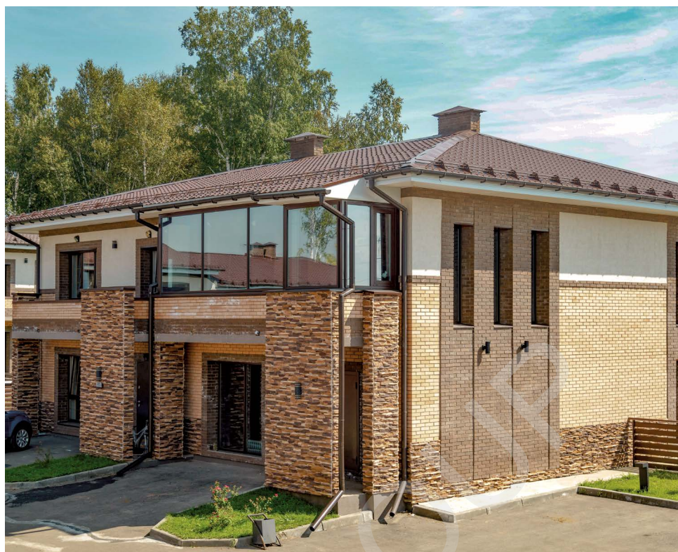
Объект реализован ГК PROSTOR GROUP, 2021г.

Мы уверены в качестве своих изделий. Поэтому наша гарантия на них самая большая на региональном рынке – до 10 лет!